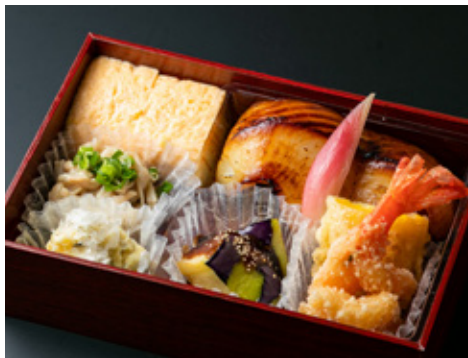
お手軽 晩酌セット 2800[税込]

[写真は一例] 出汁巻き玉子、しば漬けポテトサラダ、鶏とキノコのボン酢和え、丸茄子田楽、万願寺唐辛子焼き浸し、和牛肩ロースアスパラ巻き、鮎の風干し 茗荷子、本鮭塩こうじ和え エンシャ胡瓜、炙りホタテ土佐酢ジュレがけトマトアスパラ、スッポン春巻き、海老おかし揚げ獅子唐、とうもろこし天ぷら 雲丹塩まぶし