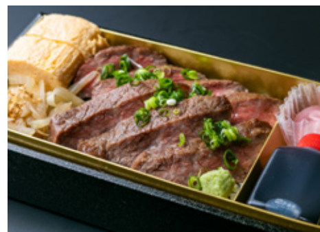
和牛ステーキ重 3800[税込]