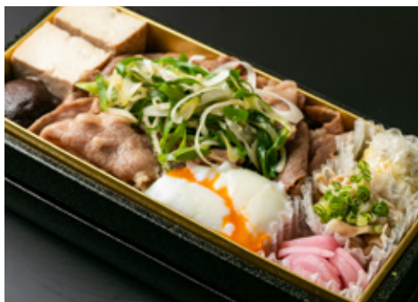
和牛すき煮重 2700[税込]

出汁巻き玉子、しば漬けポテトサラダ、鶏とキノコのボン酢和え、丸茄子田楽、万願寺唐辛子焼き浸し、里芋唐揚げ、海老おかし揚げ獅子唐、とうもろこし天ぷら、煮穴子、漬物