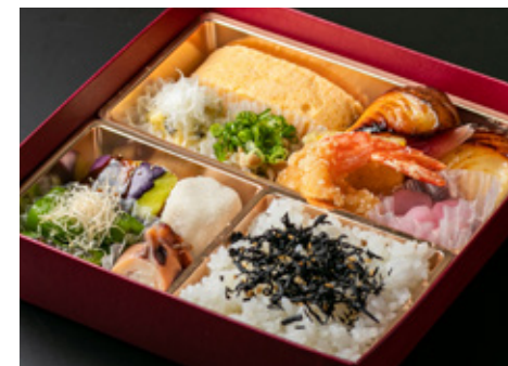
特上銀だら西京焼き弁当 3600[税込]

銀だら西京焼き、出汁巻き玉子、きんぴら、しば漬けポテサラ、漬物、ご飯、甘酢みょうが