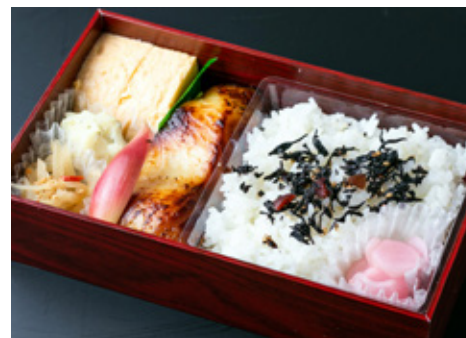
銀だら西京焼き弁当 1800[税込]

和牛肩ロース、焼き豆腐、椎茸、九条葱、温泉玉子、しば漬けポテトサラダ、鶏とキノコのボン酢和え