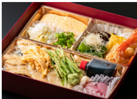
炙り煮穴子弁当 3500[税込]

[写真は一例] 出汁巻き玉子、しば漬けポテトサラダ、鶏とキノコのボン酢和え、銀ダラ西京焼き茗荷子、丸茄子田楽、海老おかし揚げ獅子唐、とうもろこし天ぷら 雲丹塩まぶし