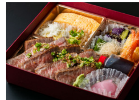
和牛ステーキ弁当 4800[税込]

出汁巻き玉子、しば漬けポテトサラダ、鶏とキノコのボン酢和え、丸茄子田楽、万願寺唐辛子焼き浸し、里芋唐揚げ、海老おかし揚げ獅子唐、とうもろこし天ぷら、和牛ステーキ、漬物